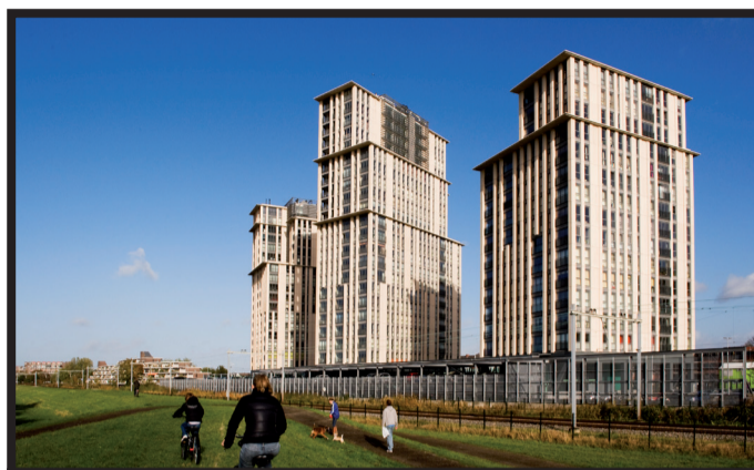
Schitterend wonen in de Waterwegtorens

De Bruynzeel keuken heeft een gezellige hoekopstelling en is van inbouwapparatuur voorzien. Ook de badkamer en het toilet zijn luxe afgewerkt. Elk appartement beschikt over een eigen parkeerplaats in de parkeergarage. Ook is er een lift en desgewenst een scootmobielplaats aanwezig.