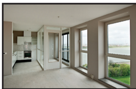
Merellaan 1205 ●●●●