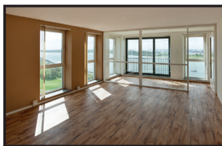
Merellaan 1201 ●●●●

Open Huis: zaterdag 17 mei van 13.00 tot 15.00 uur U bent van harte welkom om de appartementen te bezichtigen